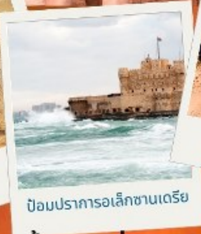
ป้อมปราการอเล็กซานเดรีย