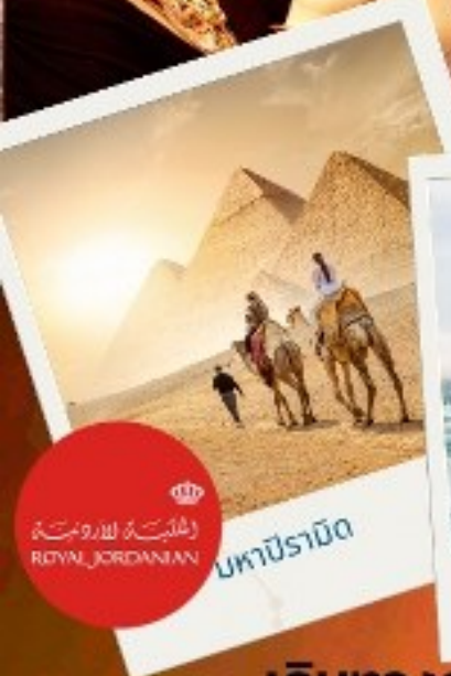
มหาปิรามิด