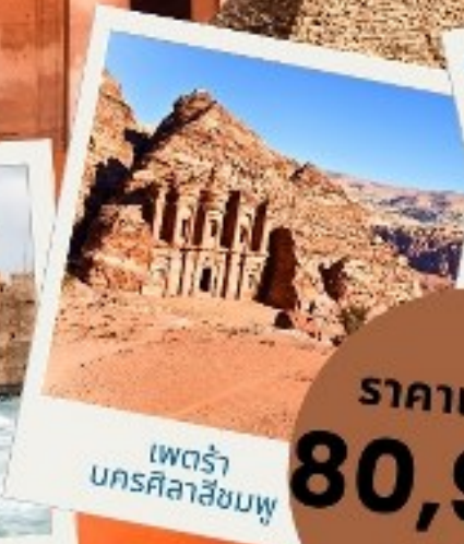
เพตรา นครศิลาสีชมพู