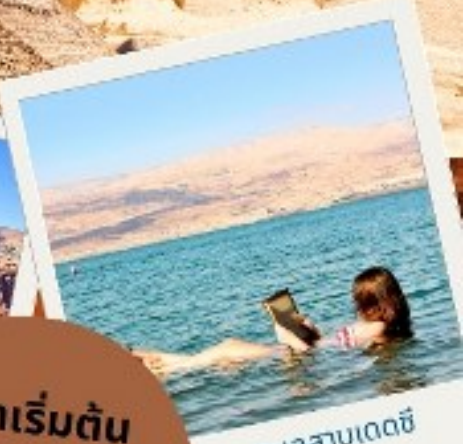
ทะเลสาบเดดซี