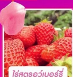
โรสตรอว์เบอร์รี่

เริ่มเดินทาง 01 มี.ค.-30 มิ.ย. 2567 บินโดย Jeju Air JEJUair น้ำหนักกระเป๋า 20 Kg.