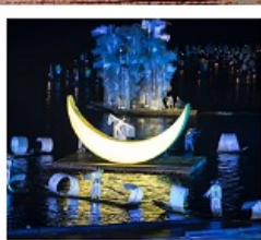
โซ่วหลิวชานเจีย