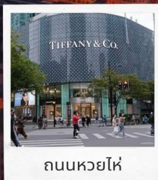
ถนนหวยไห่