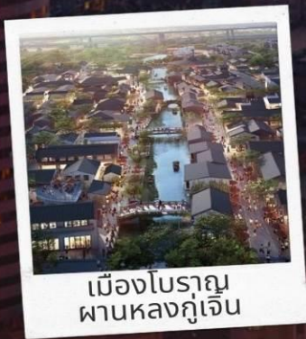
เมืองโบราณ ผานหลงกุ่เจิน