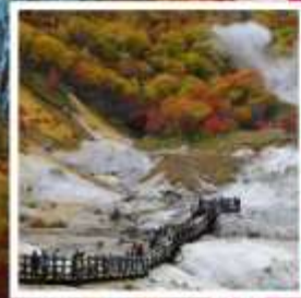
หุบเขานรก จิโคะคุดามิ