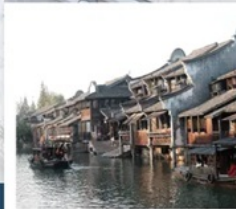
เมืองโบราณผานหลงกุ่จั้น