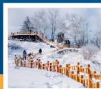
เขาเกาะหยู๋