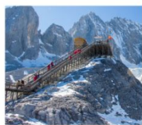
กุอาหิมะมิงกรหยก

เมืองโบราณด้าหลี่ / เจดีย์สามองค์ / โถงแรกแม่น้ำแยงซี / เมืองโบราณเซงกรี่ล่า วัดลามะ-ชงจันหลิง / ซ่องแคบสี่กักระโอด / เมืองโบราณซูเหอ / กุอาหิมะมิงกรหยก หุบเขาพระจันทร์สีน้ำเงิน / โข่วจางอวี๋หมว / สระน้ำมิงกรด้า - เมืองโบราณลี่เจียง เขาชี้ซาน / ประตุมิงกร / วัดหยวนทง / สวนด้ากวนโหลว