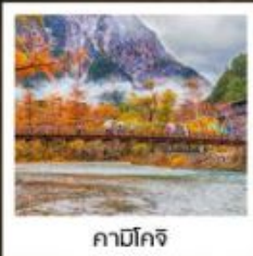
คามิโคจิ

ลิ้มรสเมนูสุดพิเศษ บุฟเฟ่ต์ซาซิมิอื่น ๆ / ซาซิมิระดับพรีเมียม