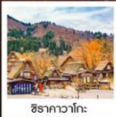
ชิราคาวาโกะ