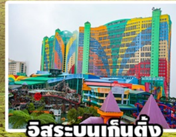
อิสระบนเก็นตัง