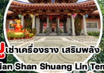
บู เข้าเครื่องราง เสริมพลัง Lian Shan Shuang Lin Temple