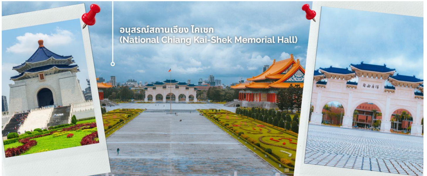
อนุสรณ์สถานเจียง ไคเชก (National Chiang Kai-Shek Memorial Hall)