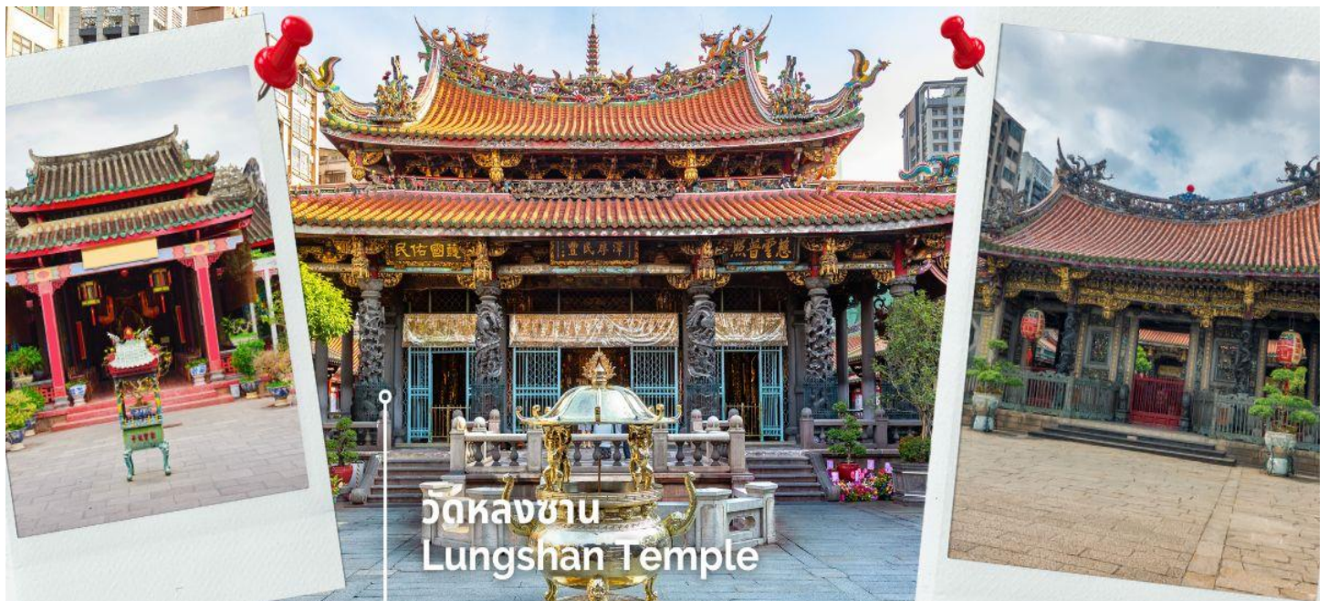
วัดหลงซาน Lungshan Temple

นำท่านสักการะ วัดหลงซาน เป็นหนึ่งในวัดที่เก่าแก่และมีชื่อเสียงมากที่สุดแห่งหนึ่งของเมืองไทเป ตั้งอยู่ในแถบย่านเมืองเก่า มีอายุเกือบ 300 ปี สร้างขึ้นโดยคนจีนชาวผู้เจี้ยนช่วงปีค.ศ. 1738 เพื่อเป็นสถานที่สักการะบูชาสิ่งศักดิ์สิทธิ์ตามความเชื่อของชาวจีน มีรูปแบบทางด้านสถาปัตยกรรมคล้ายกับวัดพุทธของจีน แต่มีลูกผสมของความเป็นไต้หวันเข้าไปด้วย ทำให้ที่นี่เป็นอีกหนึ่งแหล่งท่องเที่ยวที่ไม่ควรพลาด และภายในก็ยังมีเทพเจ้าองค์อื่นๆตามความเชื่อของชาวจีนอีกมากกว่า 100 องค์ด้านในมาจากทั้งศาสนาพุทธ เต๋า และขงจื้อ เช่น เจ้าแม่ทับทิม ที่เกี่ยวข้องกับการเดินทาง, เทพเจ้ากวนอู เรื่องความซื่อสัตย์และหน้าที่การงาน และเทพยเว้วเหล่า หรือ ผู้เฒ่าจันทรา ที่เชื่อกันว่าเป็นเทพผู้ก่อด้ายแดงให้สมหวังด้านความรัก