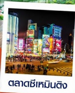
ตลาดซีเหมินติง