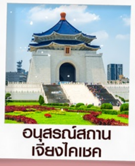
อนุสรณ์สถาน เจียงไคเชก