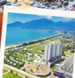
Mikazuki Japanese Resorts & Spa