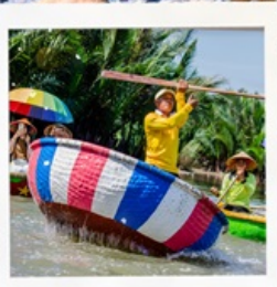
เรือกระดังง์