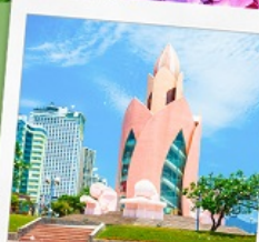
อาคารตอกบัว