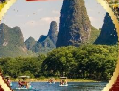
ล่องแพแม่น้ำหลีเจียง