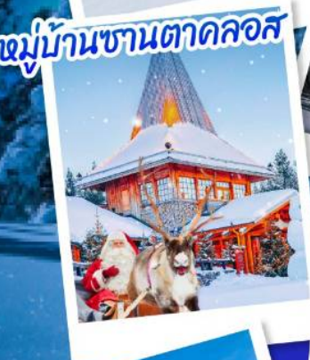
หมู่บ้านซานตาคลอส