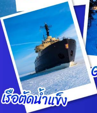
เรือตัดน้ำแข็ง