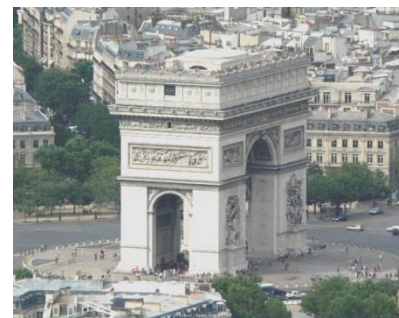
ประตูชัย ARC DE TRIOMPHE