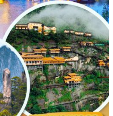
หุบเขาเทวดา

เมนูพิเศษ!! เปิดปักกิ่ง หมูแดง ปลาหมักเป็ยร้อฮยาง