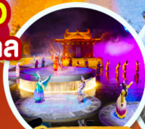
ชมโชว์อุทนีโจว