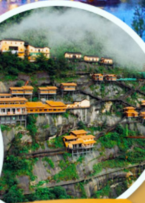
หุบเขาเทวดา