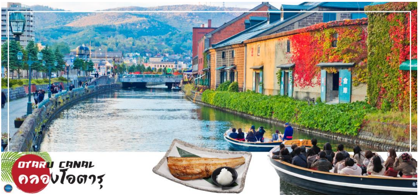
OTARU CANAL คลองโอตารุ

เมืองซัปโปโร – ดิวตี้ฟรี – เมืองโอตารุ – คลองโอตารุ – พิพิธภัณฑ์กล่องดนตรี – เมืองซัปโปโร – หมู่บ้านช็อคโกแลต อิชิยะ (ด้านนอก) – ซัปโปโงทานุกิโคจิ