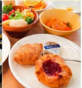
Smile Hotel Premium - Sapporo Susukino