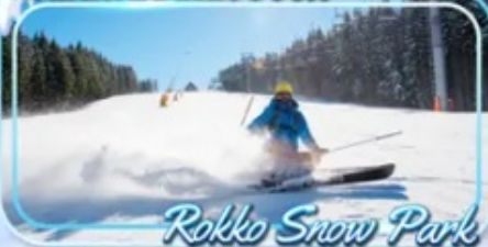
Rokko Snow Park