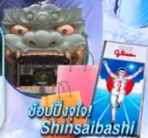
ช้อปปิ้งจุใจ! Shinsaibashi