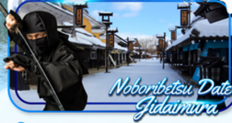
Noboribetsu Date Jidaimura