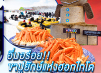
อัมมอรรอย!! ภูเขาหิมะแห่งฮอกไกโด