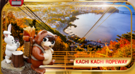
KACHI KACHI ROPEWAY