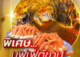
พิเศษ... บุฟเฟ่ต์ชาบู

ไฮไลท์!! สะดุดตาไปกับ ไข่มุกเปลี่ยนสี ณ อุโมงค์เมเปิ้ล หรือ โมมิจิ (ขึ้นอยู่กับฤดูกาล) เสาโทริอิสีแดง ริมทะเลสาบที่เป็นจุดถ่ายรูปยอดนิยม ณ ศาลเจ้าฮาโกเนะ นั่งกระเช้า คาชิ คาชิ ชมความสวยงามของทะเลสาบควากูจิโกะจากมุมสูง หมู่บ้านไอชิโนะฮักโกะ วิวภูเขาไฟฟูจิสีขาวตัดกับพื้นหลังสีฟ้า เป็นภาพที่สวยงามมาก