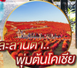
ละลานตา.. พุ่มต้นโคเซี่ย