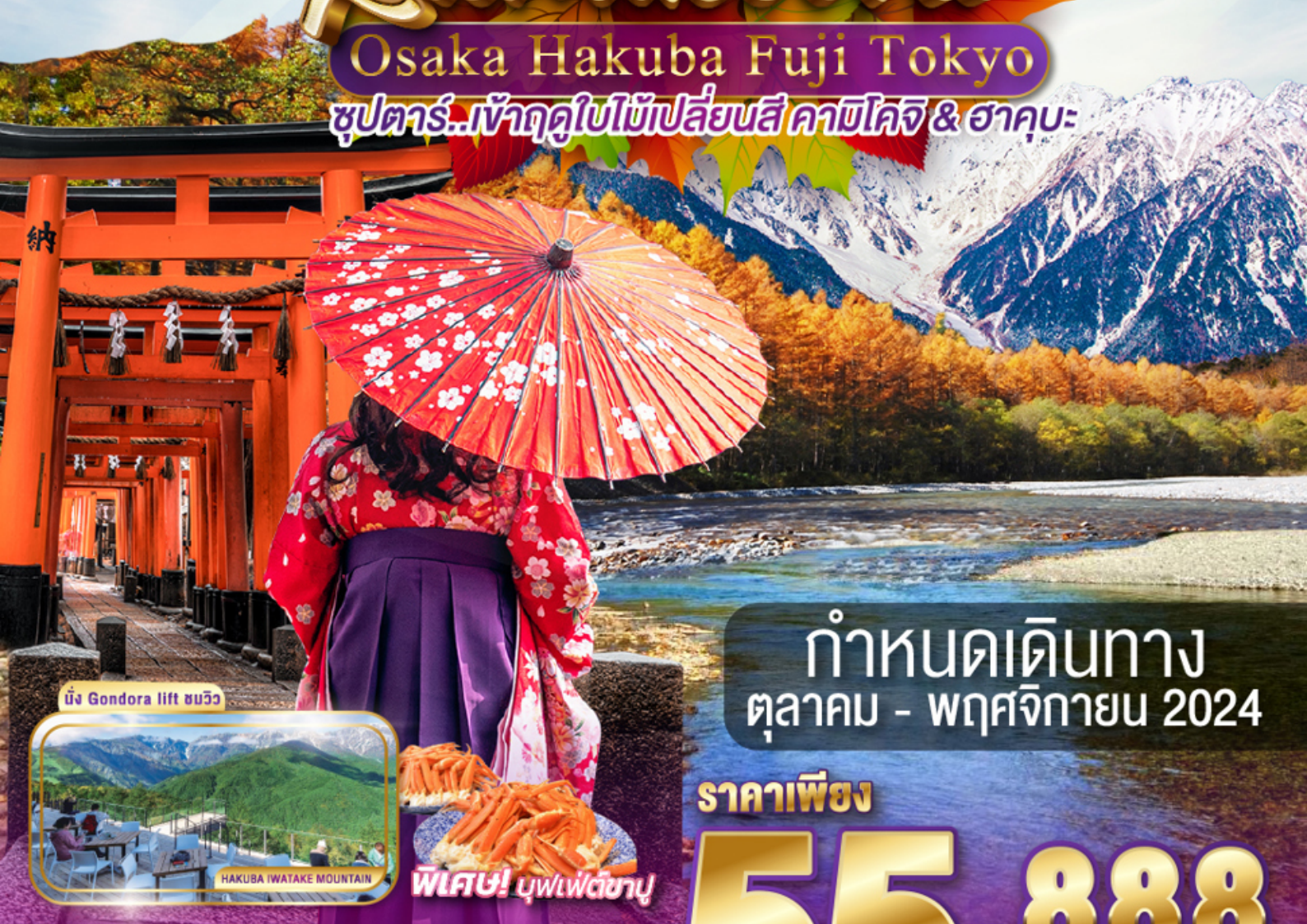
นั่ง Gondora lift ชมวิว

ซูปรคาร์..เจ้าฤดูใบไม้เปลี่ยนสี คาบิโคจิ & ฮาคุบะ