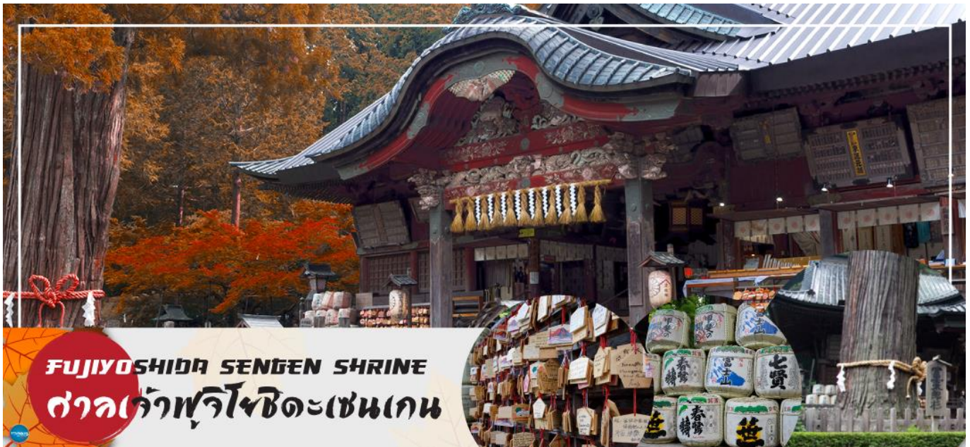
FUJIYOSHIDA SENGEN SHRINE ศาลเจ้าฟูจิโยชิเดะเซนเกน

เมืองยามานาชิ – ศาลเจ้าฟูจิโยชิเดะเซนเกน – พิธีชงชาญี่ปุ่น – กรุงโตเกียว – ชมแมวยักษ์ 3 มิติ พร้อมช้อปปิ้ง ย่านชินจูกุ – เมืองนาริตะ