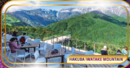
HAKUBA IWATAKE MOUNTAIN