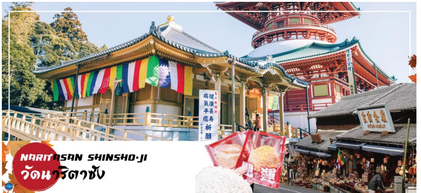
NARITASAN SHINSHO-JI วัดนาริตะชิน

วันที่หก เมืองนาริตะ – วัดนาริตะชิน – ถนนโอมโตะซังโตะ – ย่านโอไดบะ – ห้างไดเวอร์ซิตี – ท่าอากาศยานนานาชาตินาริตะ – ท่าอากาศยานสุวรรณภูมิ