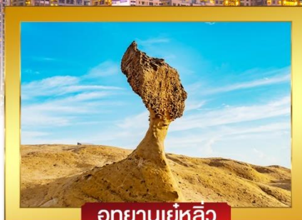
อุทยานเย่หลิว