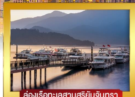
ล่องเรือทะเลสาบสุริยันจันทรา