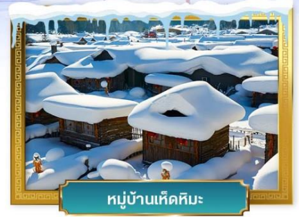
หมู่บ้านหิมะ

เดินทางโดย : สายการบินโซน่า เซาเทิร์น แอร์ไลน์