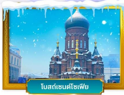
โบสถ์เซนต์ไอแซค