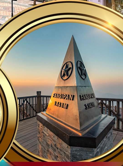
ฟานชิปัน