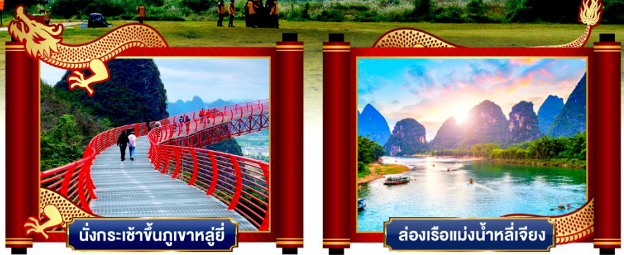
นั่งกระเช้าขึ้นภูเขาหลู่ยี่