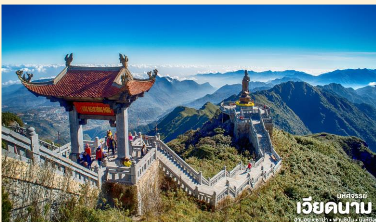
เม็คจอร์ซี่ เวียดนาม ฮานอย • ซาปา • ฟานซิปัน • นิงห์บิ่งห์