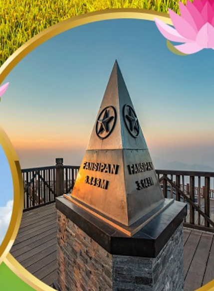
ฟานชิปัน