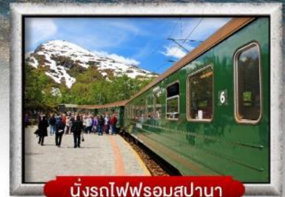
นั่งรถไฟพร้อมสปานา

พิเศษ! พักบนเรือสำราญ แบบ Window Room 2 คืน, พักบ้านแซนต้าคลอส