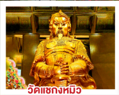
วัดแกลงหมี