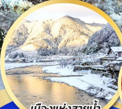
เมืองแห่งสายน้ำ กุโจะจิมัง