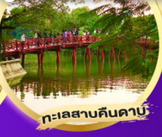
ทะเลสาบคินคาบ