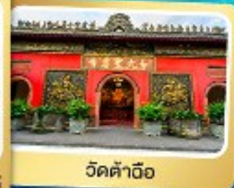
วัดต้าอ้อ