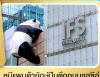
หมีแพนด้ายักษ์ง่ปิ่นตึกถนนซูลซู่