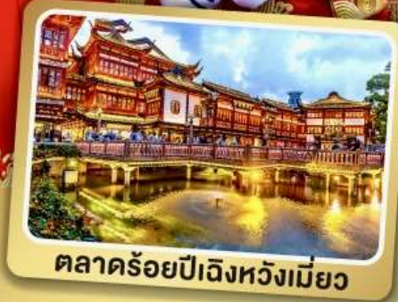
ตลาดร้อยปีเฉิงหวังเหมียว