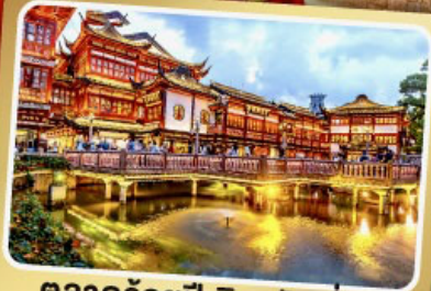
ตลาดร้อยปีเจิ้งหวังเหมียว