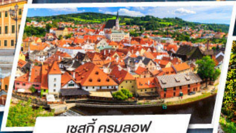
เซสกี ครุมลอฟ