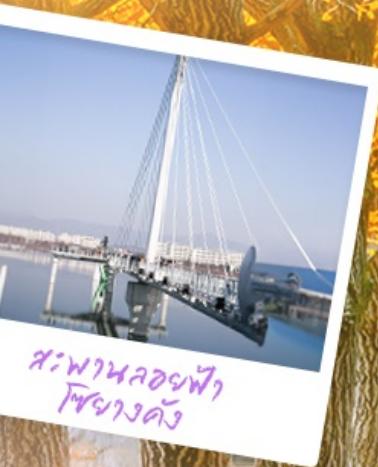
สะพานลอยฟ้า โซยางคัง