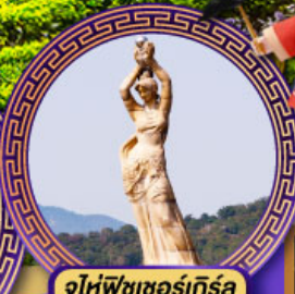
จูไห่พิงเซอร์เกิร์ส