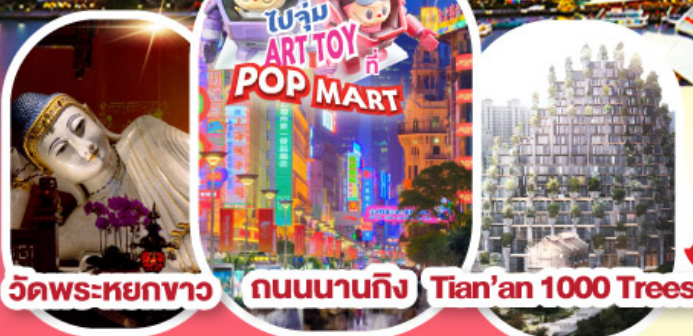
วัดพระหยกขาว ถนนนานกิง Tian'an 1000 Trees