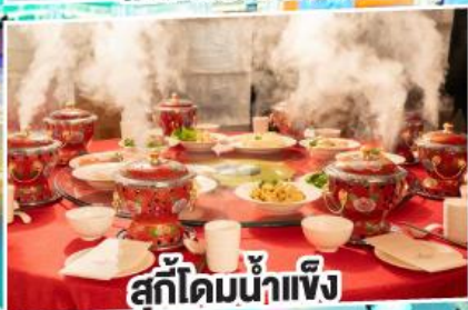
สุกี้ไคมน้ำแข็ง