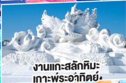
งานแกะสลักหิมะ เกาะพระอาทิตย์