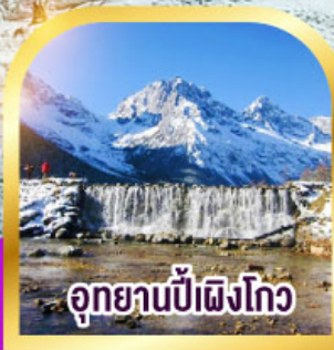
อุทยานป่าเผิงโกว