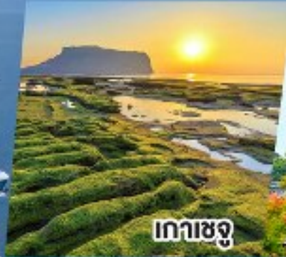
เกาะเชจู