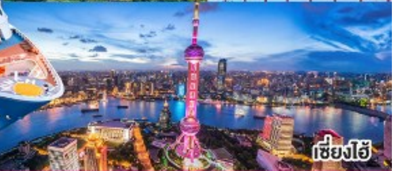
เชียงใหม่