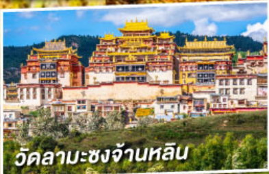
วัดลามะชงจ้านหลิน