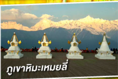
ภูเขาหิมะเหมยลี่