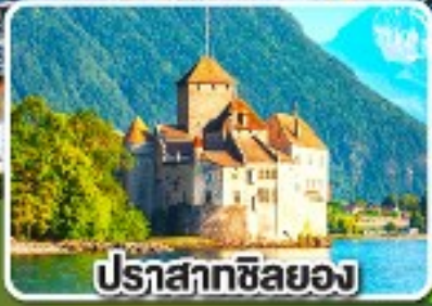
ปราสาทซิลยอง