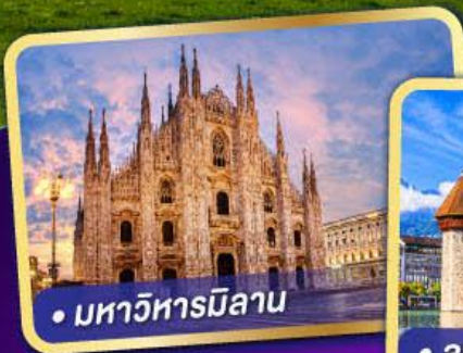
• มหาวิหารมิลาน