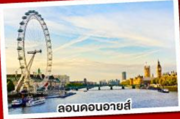
ลอนดอนอายส์