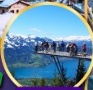
ยอดเขา ฮาร์เตอร์คลุม