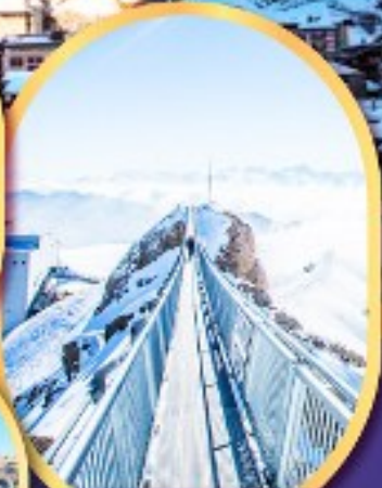
ยอดเขา กลาเซียร์ 3000