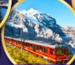
ยอดเขาจุงเฟรา