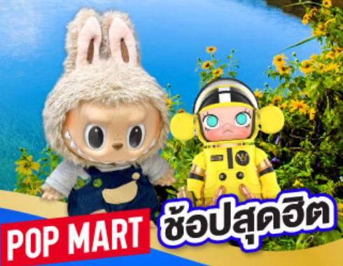
POP MART ซ้อปสุดฮิต