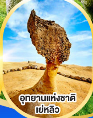
อุทยานแห่งชาติ เย่หลิว