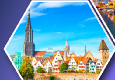
อุล์มบ้านเกิดไอน์สไตน์