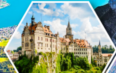
ปราสาทชิกมาริงเก็ม